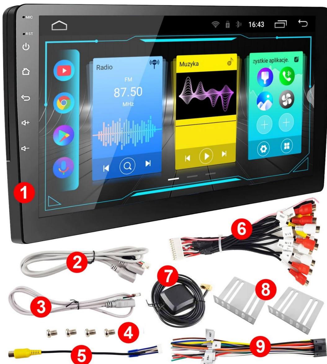
Foto je pouze ilustrační. Některé součásti sady se mohou lišit v závislosti na verzi