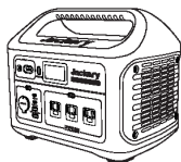
Jackery Explorer 1000