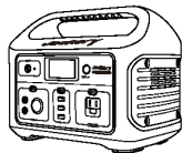
Jackery Explorer 500