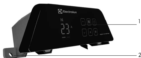
Obr. 2 Řídicí jednotka