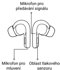
Mikrofon pro předávání signálu