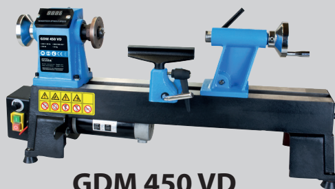
GDM 450 VD