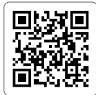
MAVIC 3 PRO CINE

Podle příslušného dronu navštivte odkaz nebo naskenujte QR kód níže a podívejte se na výuková videa, která ukazují, jak bezpečně používat DJI MAVIC™ 3 Pro: