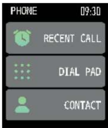
Nabídka funkcí telefonu