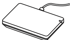
Hardwarový klíč pro síť Wi-Fi/Bluetooth (AN-WF500)