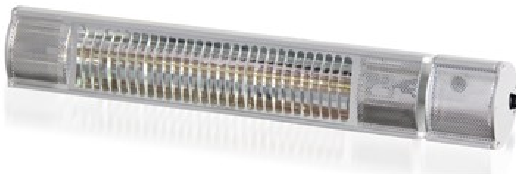
TYP SMHRC-2 ( 2 000 W)