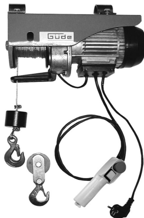
GSZ 100/200 Artikel-Nr. 55050