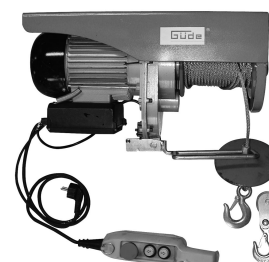
GSZ 500/1000 Artikel-Nr. 01709

Güde GmbH & Co. KG Birkichstraße 6 D-74549 Wolpertshausen