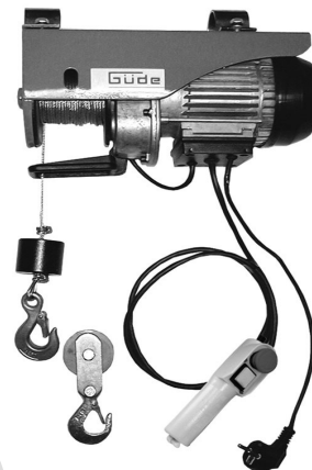
GSZ 125/250 Artikel-Nr. 55051