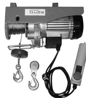
GSZ 300/600 Artikel-Nr. 01708