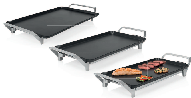
Table Chef Premium Table Chef Premium XL | Table Chef Premium XXL 01.103100.01.001 | 01.103110.01.001 | 01.103120.01.001

PARTS DESCRIPTION / ONDERDELENBESCHRIJVING / DESCRIPTION DES PIÈCES / TEILEBESCHREIBUNG / DESCRIPCIÓN DE LAS PIEZAS / DESCRIÇÃO DOS COMPONENTES / DESCRIZIONE DELLE PARTI / BESKRIVNING AV DELAR / OPIS CZĘŚCI / POPIS SOUČÁSTÍ / POPIS SOUČASTI / ОПИСАНИЕ ЗАПЧАСТИ