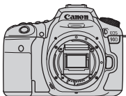
Fotoaparát (s krytkou těla)

Než začnete s fotoaparátem pracovat, zkontrolujte, zda balení obsahuje všechny následující položky. Pokud některá položka chybí, obraťte se na prodejce.