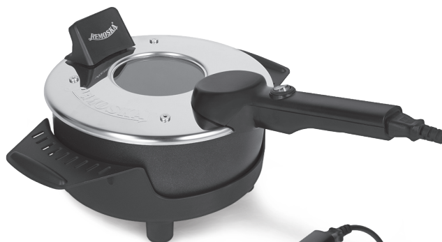
P31 F, P32 F