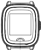
Return key Answer call