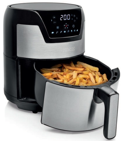
Digital Aerofryer XXL 01.182026.01.001

PARTS DESCRIPTION / ONDERDELENBESCHRIJVING / DESCRIPTION DES PIÈCES / TEILEBESCHREIBUNG / DESCRIPCIÓN DE LAS PIEZAS / DESCRIÇÃO DOS COMPONENTES / DESCRIZIONE DELLE PARTI / BESKRIVNING AV DELAR / OPIS CZĘŚCI / POPIS SOUČÁSTI / POPIS SUČASTI / ОПИСАНИЕ ЗАПЧАСТИ