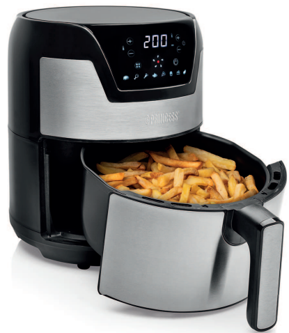
Digital Aerofryer XXL 01.182026.01.001

PARTS DESCRIPTION / ONDERDELENBESCHRIJVING / DESCRIPTION DES PIÈCES / TEILEBESCHREIBUNG / DESCRIPCIÓN DE LAS PIEZAS / DESCRIÇÃO DOS COMPONENTES / DESCRIZIONE DELLE PARTI / BESKRIVNING AV DELAR / OPIS CZĘŚCI / POPIS SOUČÁSTI / POPIS SUČASTI / ОПИСАНИЕ ЗАПЧАСТИ