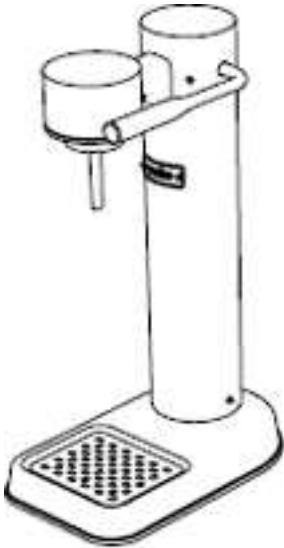
Výrobník perlivé vody