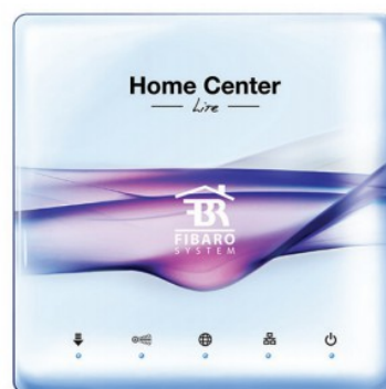
Home Center Lite