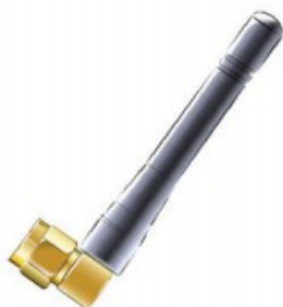
Prutová anténa - SMA