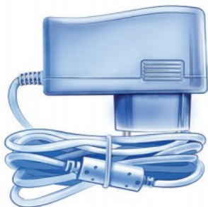
Napájecí adaptér AC/DC -12V/1A