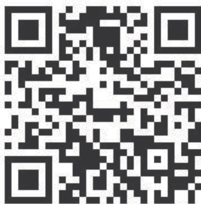
QR kód aplikace

Zapněte bluetooth před instalací aplikace. Vyhledejte aplikaci Carney FIT / Android / Google Play nebo App Store pro iOS. Můžete také naskenovat kód QR uveden níže (kompatibilita: iOS 8 nebo vyšší / Android 5.0 nebo vyšší)