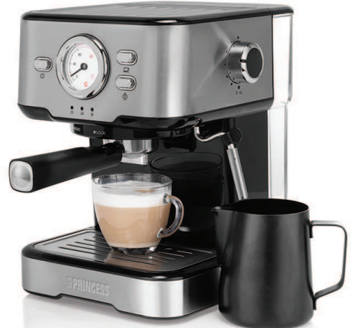
Espresso Machine 01.249412.01.001

PARTS DESCRIPTION / ONDERDELENBESCHRIJVING / DESCRIPTION DES PIÈCES / TEILEBESCHREIBUNG / DESCRIPCIÓN DE LAS PIEZAS / DESCRIÇÃO DOS COMPONENTES / DESCRIZIONE DELLE PARTI / BESKRIVNING AV DELAR / OPIS CZĘŚCI / POPIS SOUČÁSTI / POPIS SUČASTI / ОПИСАНИЕ ЗАПЧАСТИ