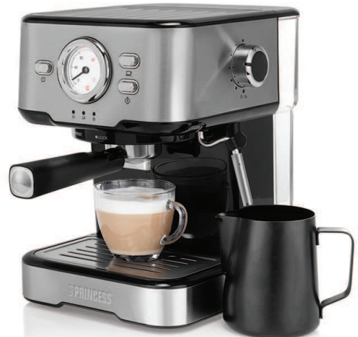
Espresso Machine 01.249412.01.001

PARTS DESCRIPTION / ONDERDELENBESCHRIJVING / DESCRIPTION DES PIÈCES / TEILEBESCHREIBUNG / DESCRIPCIÓN DE LAS PIEZAS / DESCRIÇÃO DOS COMPONENTES / DESCRIZIONE DELLE PARTI / BESKRIVNING AV DELAR / OPIS CZĘŚCI / POPIS SOUČÁSTÍ / POPIS SUČASTI / ОПИСАНИЕ ЗАПЧАСТИ