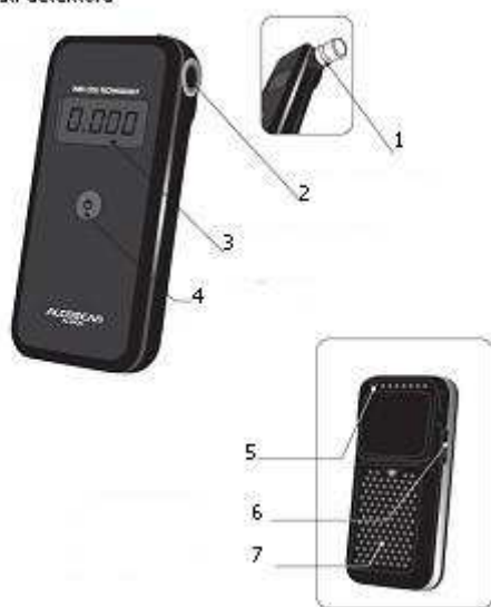
Jednotlivé části detektoru