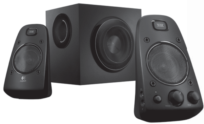
Model: S-00105 (110V~) S-00104 (220-240V~)