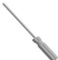
Šroubovák (není součástí balení)