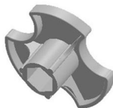
Objímkový klíč (je součástí balení)