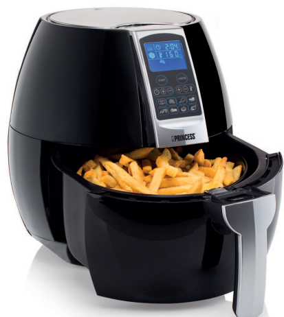
Digital Aerofryer XL 01.182020.01.001

PARTS DESCRIPTION / ONDERDELENBESCHRIJVING / DESCRIPTION DES PIÈCES / TELEBESCHREIBUNG / DESCRIPCIÓN DE LAS PIEZAS / DESCRIÇÃO DOS COMPONENTES / DESCRIZIONE DELLE PARTI / BESKRIVNING AV DELAR / POPIS SOUČASTÍ / POPIS SÚČASTÍ / PARČALINAR AÇIKLAMASI / ОПИСАНИЕ ЗАПЧАСТІ / RÉSZEGYSÉGEK LEÍRÁSA