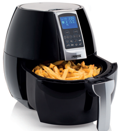
Digital Aerofryer XL 01.182020.01.001

PARTS DESCRIPTION / ONDERDELENBESCHRIJVING / DESCRIPTION DES PIÉCES / TELEBESCHREIBUNG / DESCRIPCIÓN DE LAS PIEZAS / DESCRIÇÃO DOS COMPONENTES / DESCRIZIONE DELLE PARTI / BESKRIVNING AV DELAR / POPIS SOUČÁSTÍ / POPIS SÚČASTÍ / PARČALINAR AÇIKLAMASI / ОПИСАНИЕ ЗАПЧАСТОВ / RÉSZEGYSÉGEK LEÍRÁSA