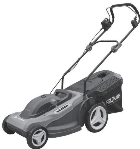
FZR 2046 E