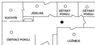
Obr.2 PRO JEDNODLAŽNÍ DŮM(BYT)