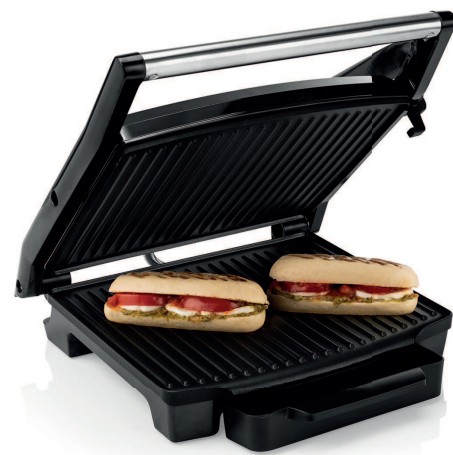
Panini Grill 01.112416.01.650

PARTS DESCRIPTION / ONDERDELENBESCHRIJVING / DESCRIPTION DES PIÈCES / TEILEBESCHREIBUNG / DESCRIPCIÓN DE LAS PIEZAS / DESCRIÇÃO DOS COMPONENTES / DESCRIZIONE DELLE PARTI / BESKRIVNING AV DELAR / OPIS CZĘŚCI / POPIS SOUČÁSTÍ / POPIS SUČASTI / ОПИСАНИЕ ЗАПЧАСТИ