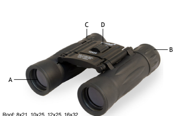
Roof: 8x21, 10x25, 12x25, 16x32